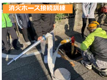
消火ホース接続訓練

有事の時、実際に消火栓を操作するのは区民のみなさまです。このように普段から災害に関心を持ち、操作に慣れていたいただくよう総合防災訓練を実施しました。 当日は対策本部を公民館に設置し、トランシーバーを用いて連絡系統に従い、各家庭の安否確認を速やかに行なうことができました。 その後、各組で消火栓取扱い訓練を行ない、元栓開閉、ホース接続を実践しました。ご協力いただいた区民の皆様、ありがとうございました。