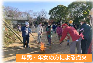
年男・年女の方による点火