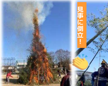
今年は煙が真直ぐに上がりました