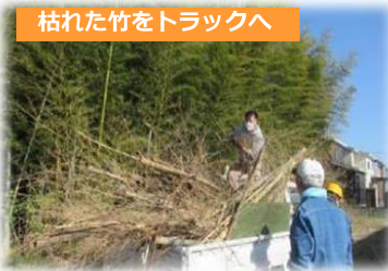
枯れた竹をトラックへ