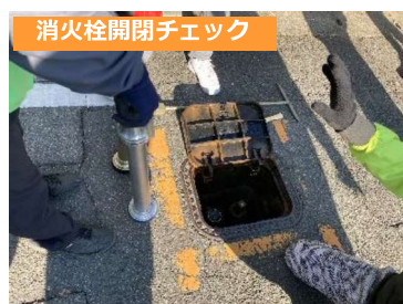
消火栓開閉チェック