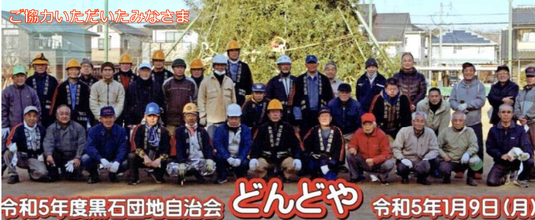
ご協力いただいたみなさま