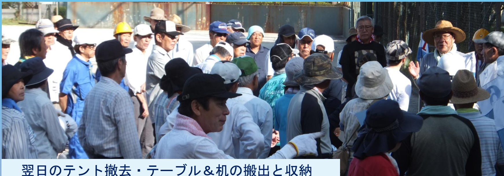
翌日のテント撤去・テーブル&机の搬出と収納