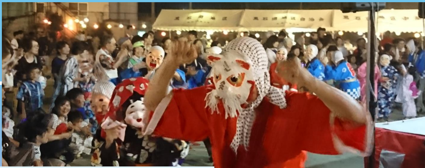
観客を笑顔にしたひょっこり踊り