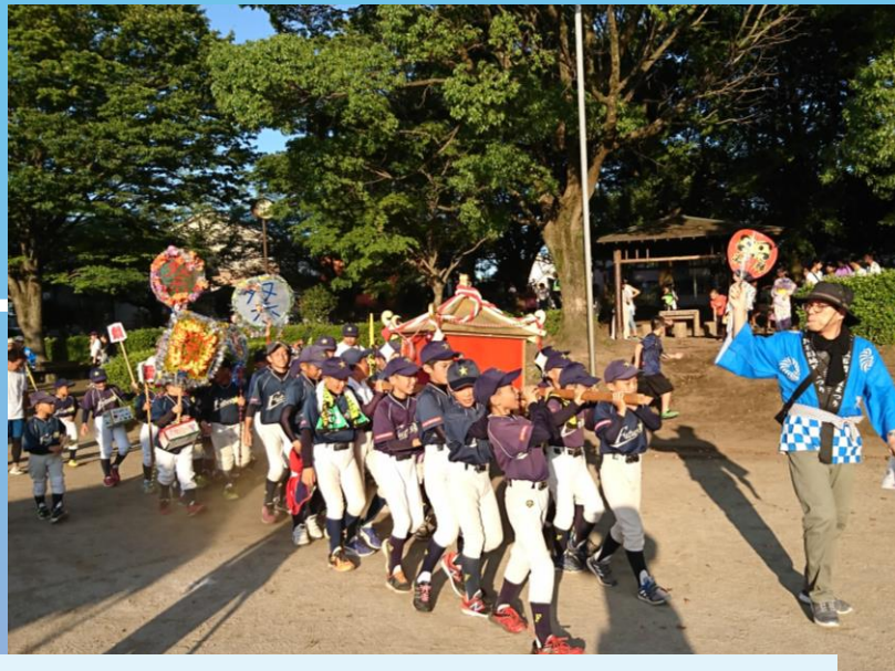
午後 6:10 子どもみこし入場「わっしょい、くろだん！！」