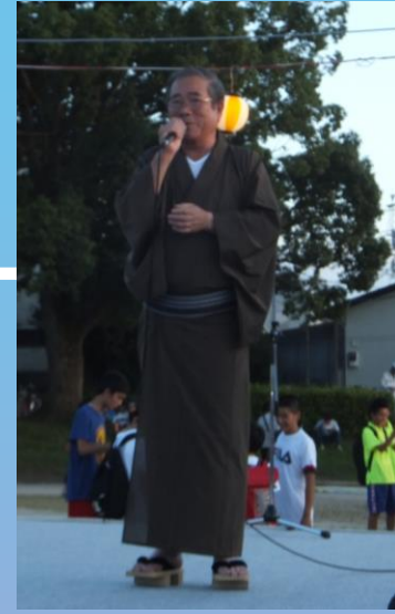
開会式 ( 開会宣言 / 区長挨拶 ・ 来賓挨拶 ・ 来賓紹介 )