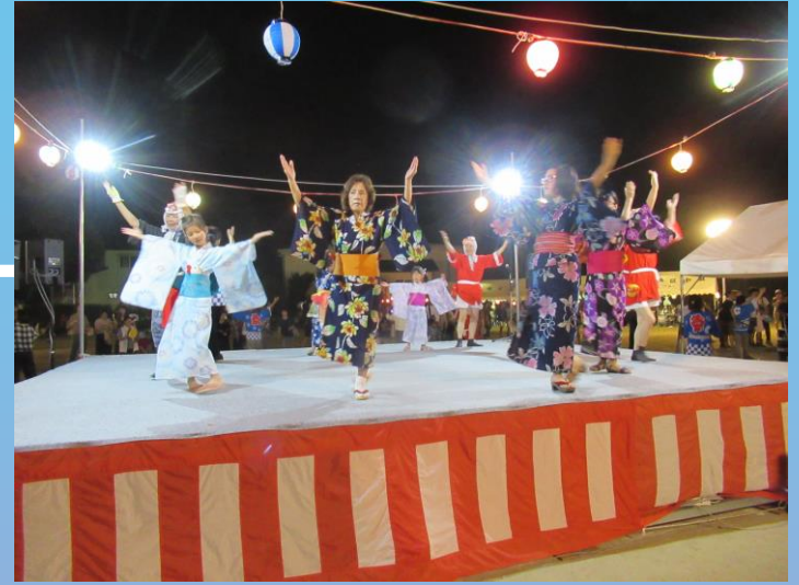
合志音頭 / 炭坑節 は、観客も引き込んで、踊りました。