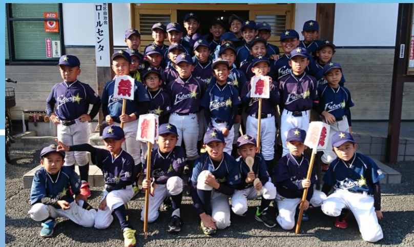
「みんなみんなコース」のフューチャーズ