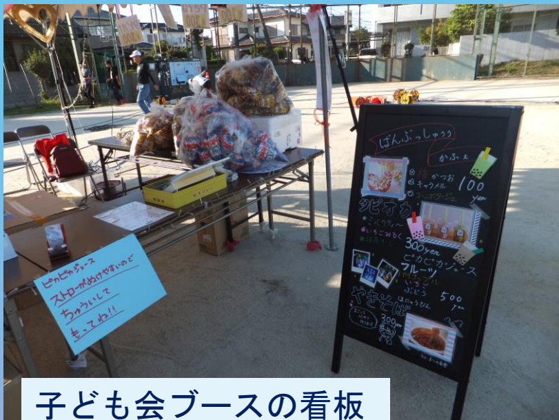
子ども会ブースの看板