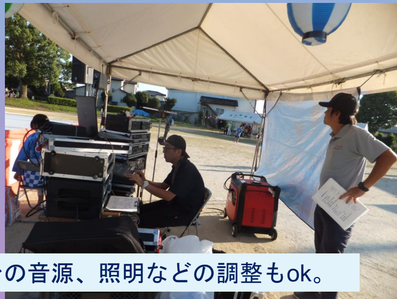
影のアナウンスリハ中。舞台の音源、照明などの調整もok。