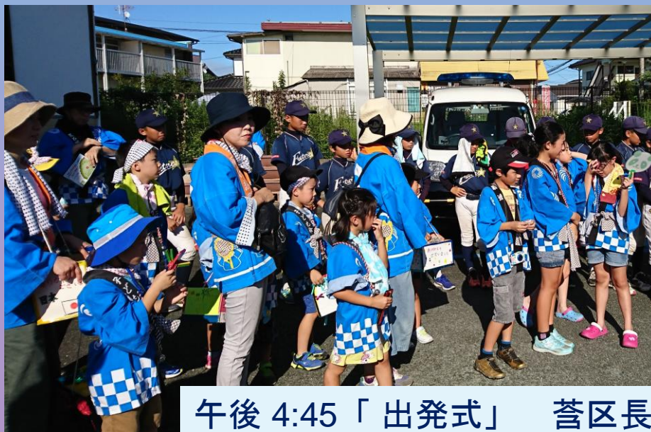
午後 4:45 「出発式」 蒼区長の挨拶