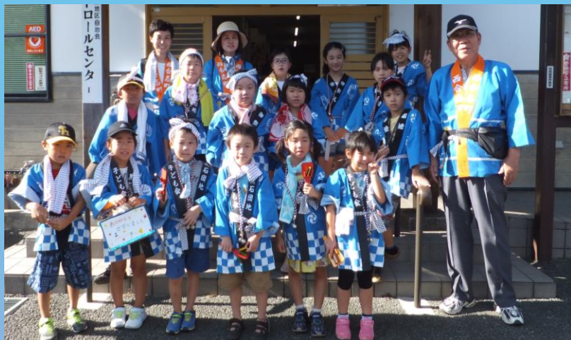
「なかよしコース」の子ども会メンバー