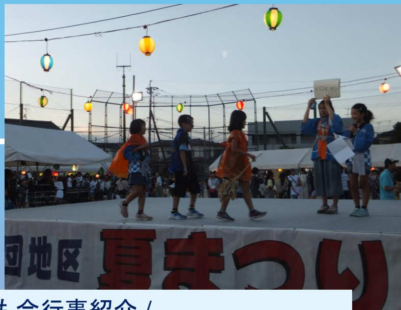
子ども会 ステージショー (子ども会行事紹介 / お菓子ボール～ キャッチしたらもらえます)